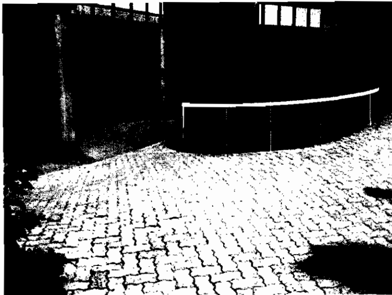
Projet n° 1 variante 1, main courante à droite du passage.

Estimation budgétaire: entre 2000 et 5000 Fr. à la charge du Contrat de Quartier